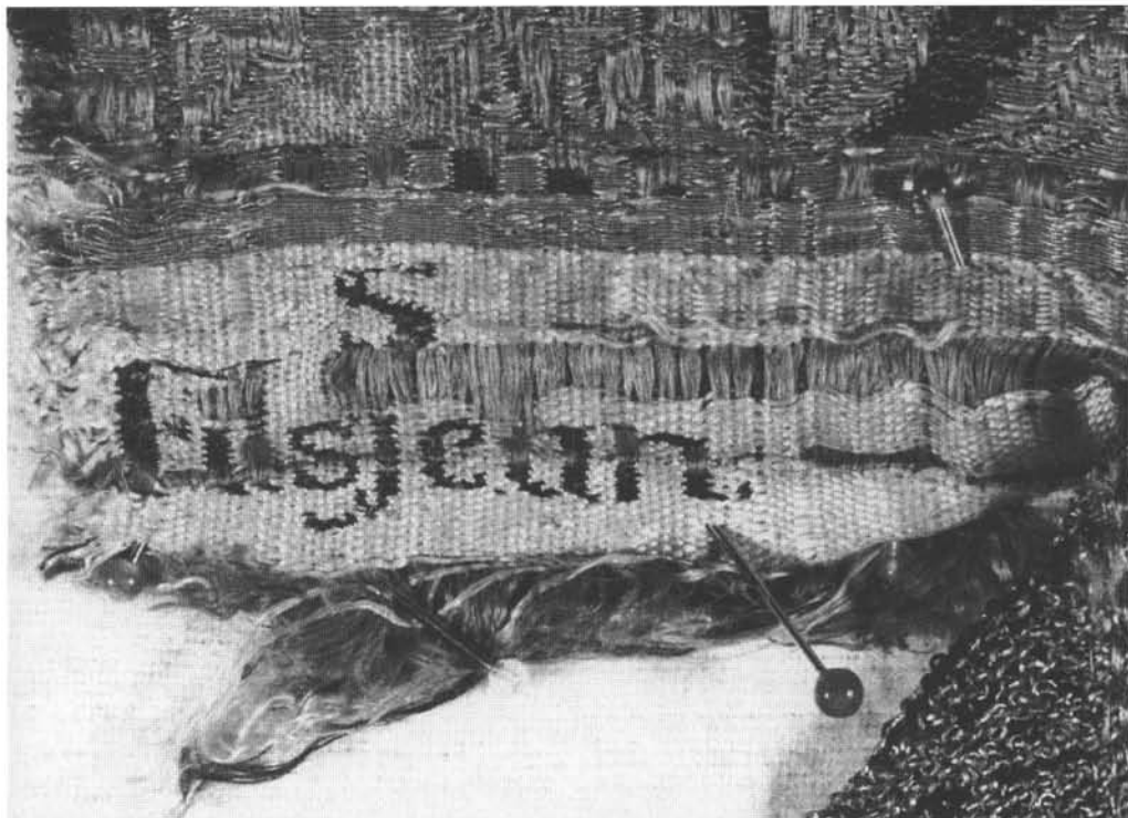
3. Sygnatura S. Filsjeana.

archiwalnych katalogu, Jadwiga Chruszczyńska uwzględniła lub sprostowała wszystkie dotychczasowe ustalenia. Na informacjach Jadwigi Chruszczyńskiej opieram krótkie przypomnienie najważniejszych faktów historycznych, niezbędnych dla właściwej oceny zakupionego obiektu.