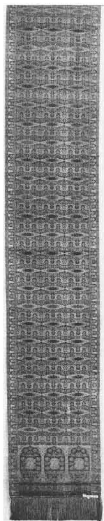
2. Odwrocie pasa.

Sygnatura Szczepana Filsjeana 4 – występująca na obu końcach pasa, była zawinięta i niewidoczna przez przyszyte frędzle 5 .